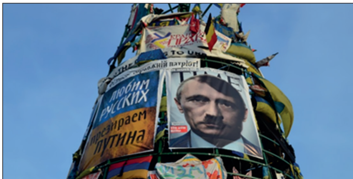
Іл. 8. Банери на майданівській «йолці» у березні 2014 р.

Уявлення про те, що В. Путін не дорівнює російському народові, зберігалося й тоді, коли Росія окупувала Крим і розпочала війну у східних областях України. Тоді на конструкції ялинки з'являються великі банери «Россия, вставай. Русский народ и народ Украины — побратимы!» 21 , «Долой Путина из Кремля... Поможем русским, спасем Украину» 22 , «Любим русских. Презираем Путина» (іл. 8).